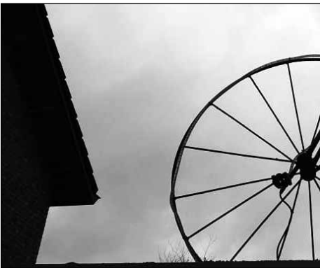
bij Van den Akker Tweewielers