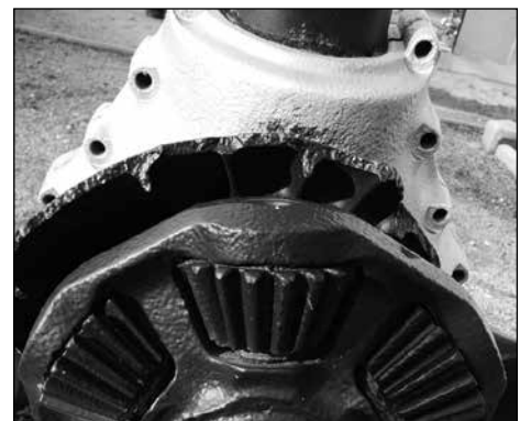
Onderdeel propellor op begraafplaats