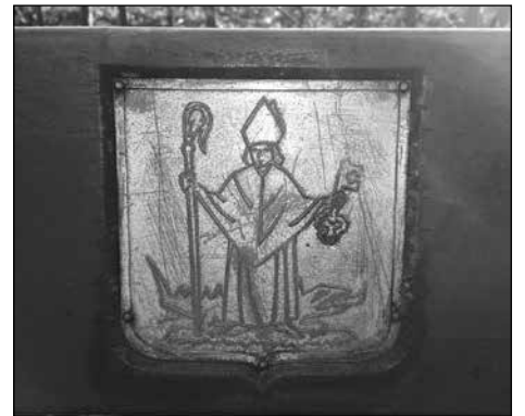
bij Antoniuskapel op 't Ham/Vogelenzang