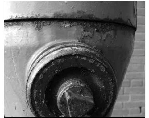
bij Brandweerpost Erp