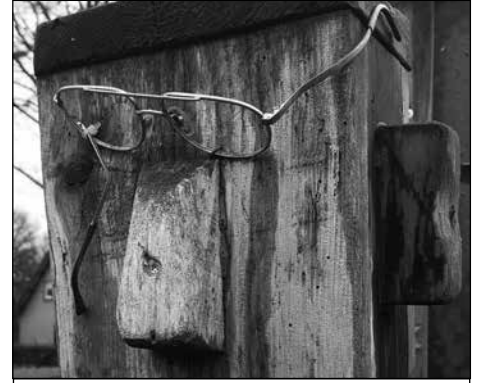
bij Zorgboerderij Japara