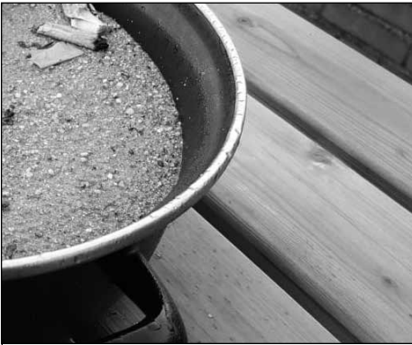
Ingang ter Aa