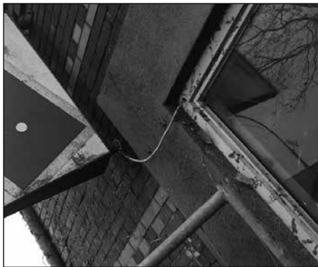
Voormalig Café Kerkhof