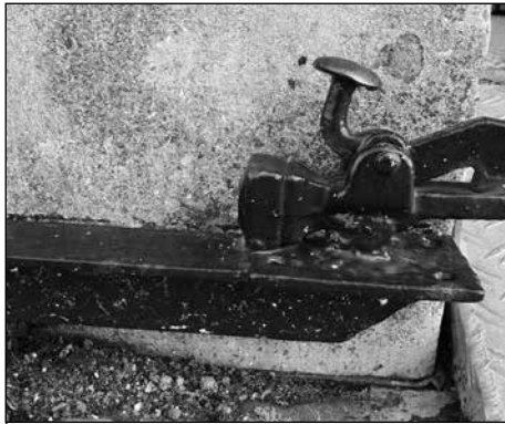
trap bij Sint Servatiuskerk