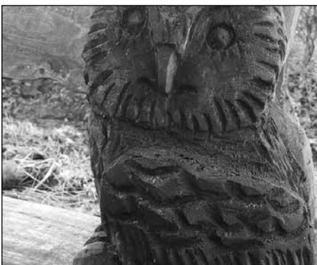
Bankje Stiphorst op 't Ham